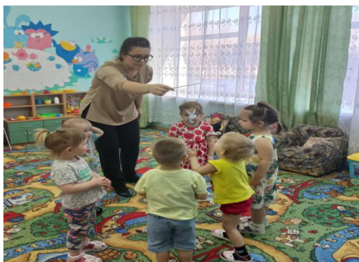
Игра «Поймай комара»