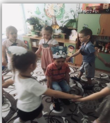
«Кот и мыши»