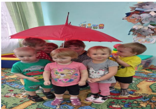
Игра «Солнышко и дождик»