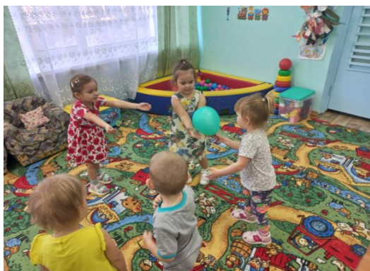
Игра «Поймай мяч»